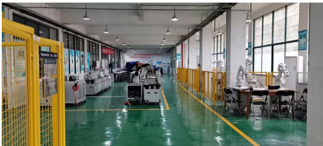
图 8 智能制造实训室