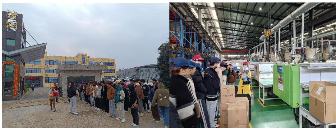
图 8 合作企业校外见习

数字化设计与制造技术专业由原模具设计与制造专业进行数字化升级改造而来，教学团队在教学改革上不断创新，结合本专业所属行业的新形势、新要求，不断进行数字化教学改革，以岗位技能及岗位应用为主线，以课程体系、教学内容、教学方法与手段等数字化改革为突破口，注重提高学生的实践动手能力，致力于培养综合素质全面发展的高素质技能人才。近年来，教学团队参与省级以上项目建设 5 项；主持精品课程 2 门；主编教材 5 本；获教学能力竞赛二等奖 1 项，指导学生参加省级技能竞赛获得二等奖 3 项，三等奖 13 项；湖南省技能抽查考核中取得优秀等级。教学团队积极与长株潭区域内的迅达科技集团、磐吉奥（集团）公司、贝斯特热流道科技有限公司等 12 家企业发展校企合作，探索产教融合新模式，共育智能制造技能人才。先后培养 4000 多名毕业生，毕业学生遍及珠三角、长三角及长株潭地区。