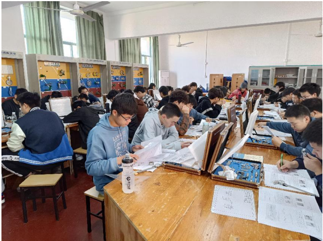
图6 精密测量实训室