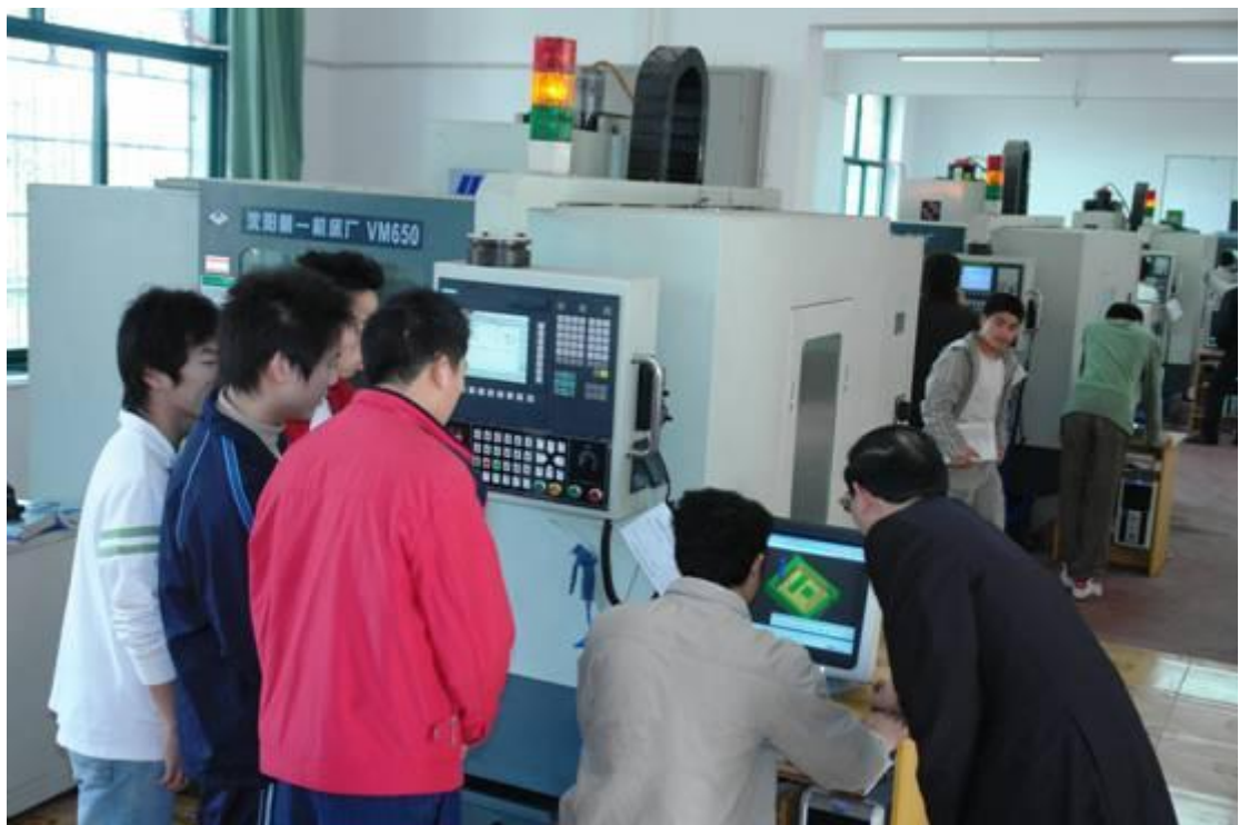
图7 数控加工实训室