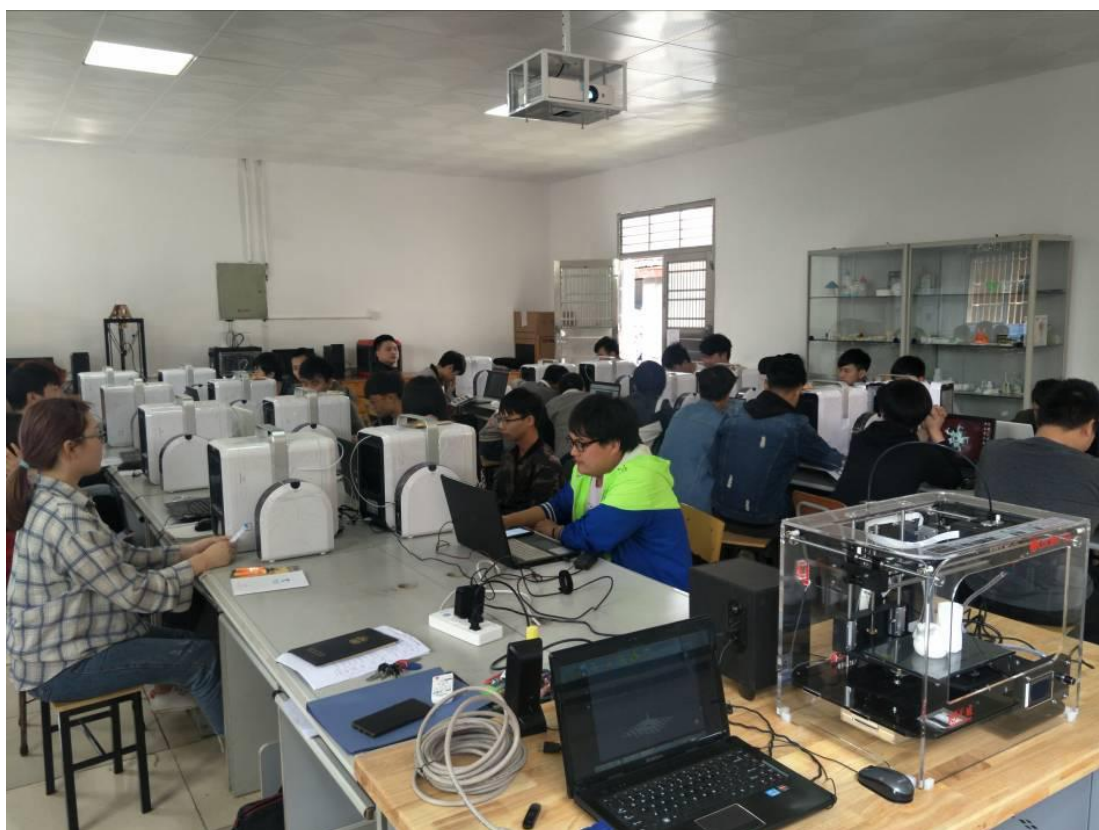
图 5 增材制造与数字化检测实训室