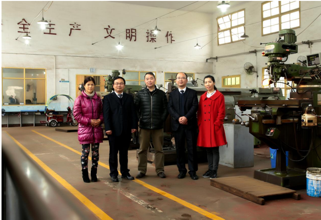
图2 数字化设计与制造技术专业教学团队