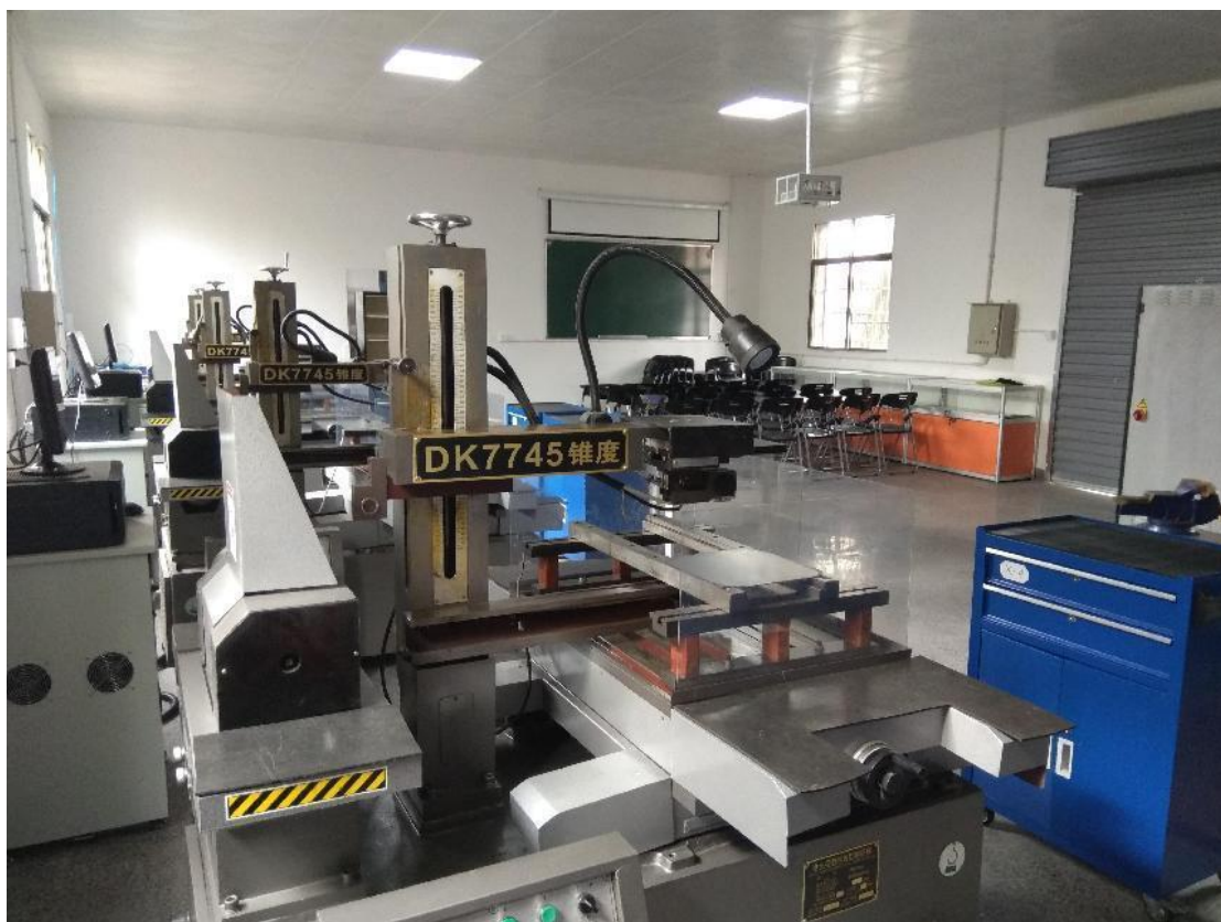
图 4 放电加工实训室