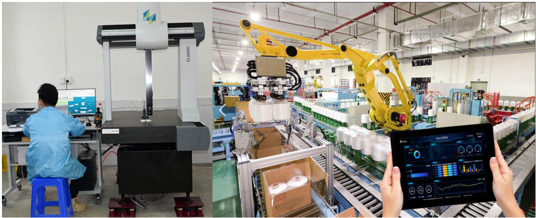
图 1 岗位任务