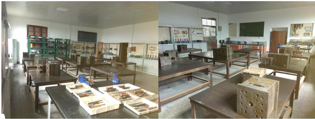
图3 模具拆装实训室

目前拥有校内实验实训室 16 个。包括钳工、机械加工、制图测绘、精密测量、液气压、数字化设计、数控加工、放电加工、智能制造实训室、数字化检测、增材制造、模具拆装、注塑与冲压生产等实训室，现有设备 80 余台套，设备总值 1108 万元。