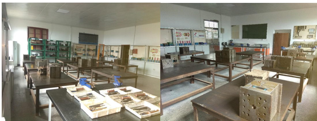
图3 机械（模具）拆装实训室

目前拥有校内实验实训室 16 个。包括机械（模具）拆装、放电加工、增材制造与数字化检测、可编程控制技术、智能制造实训室、产品数字化设计与制造、机械制图测绘等实训室，现有设备 80 余台套，设备总值 1108 万元。