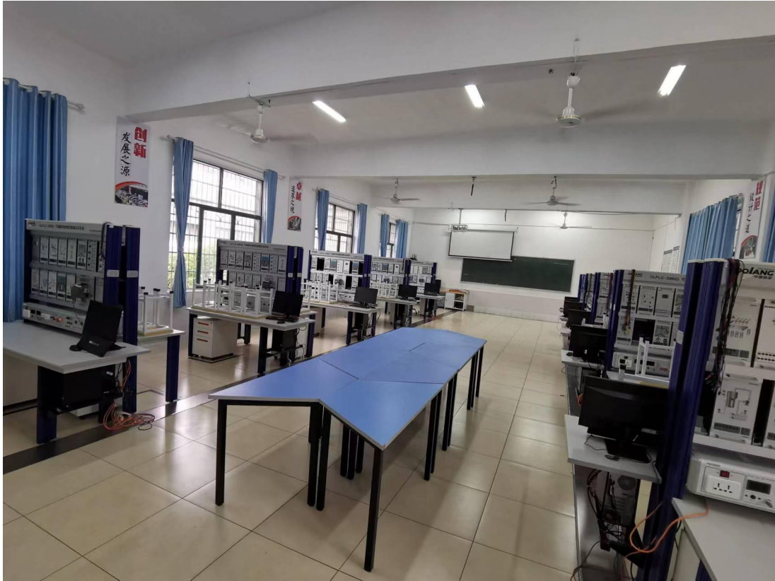
图6 可编程控制技术实训室