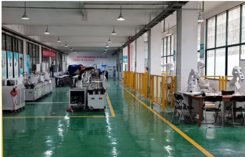
图7 智能制造实训室