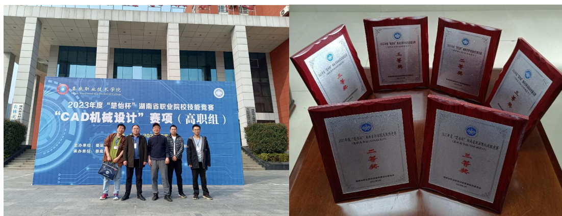
图 10 师生参加省级技能竞赛