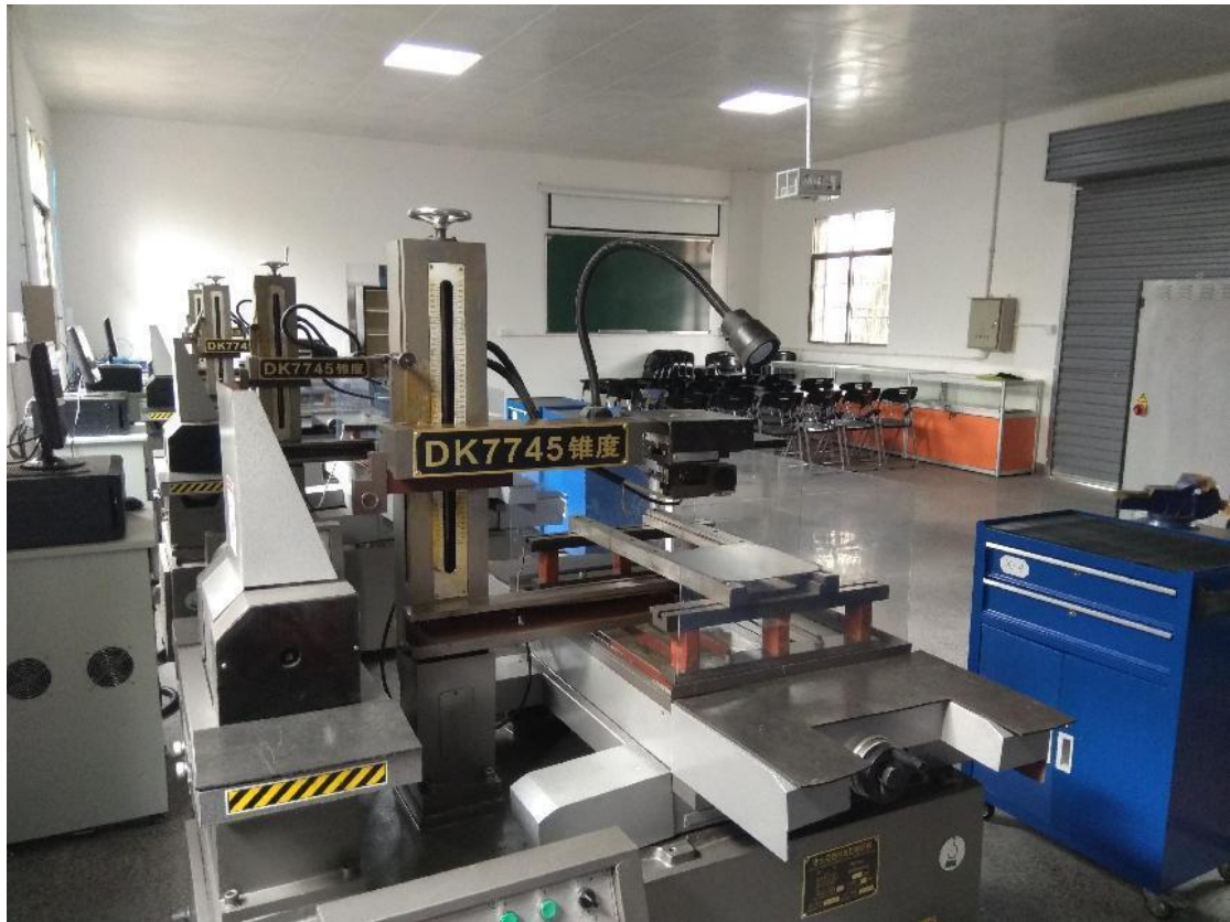
图 4 放电加工实训室