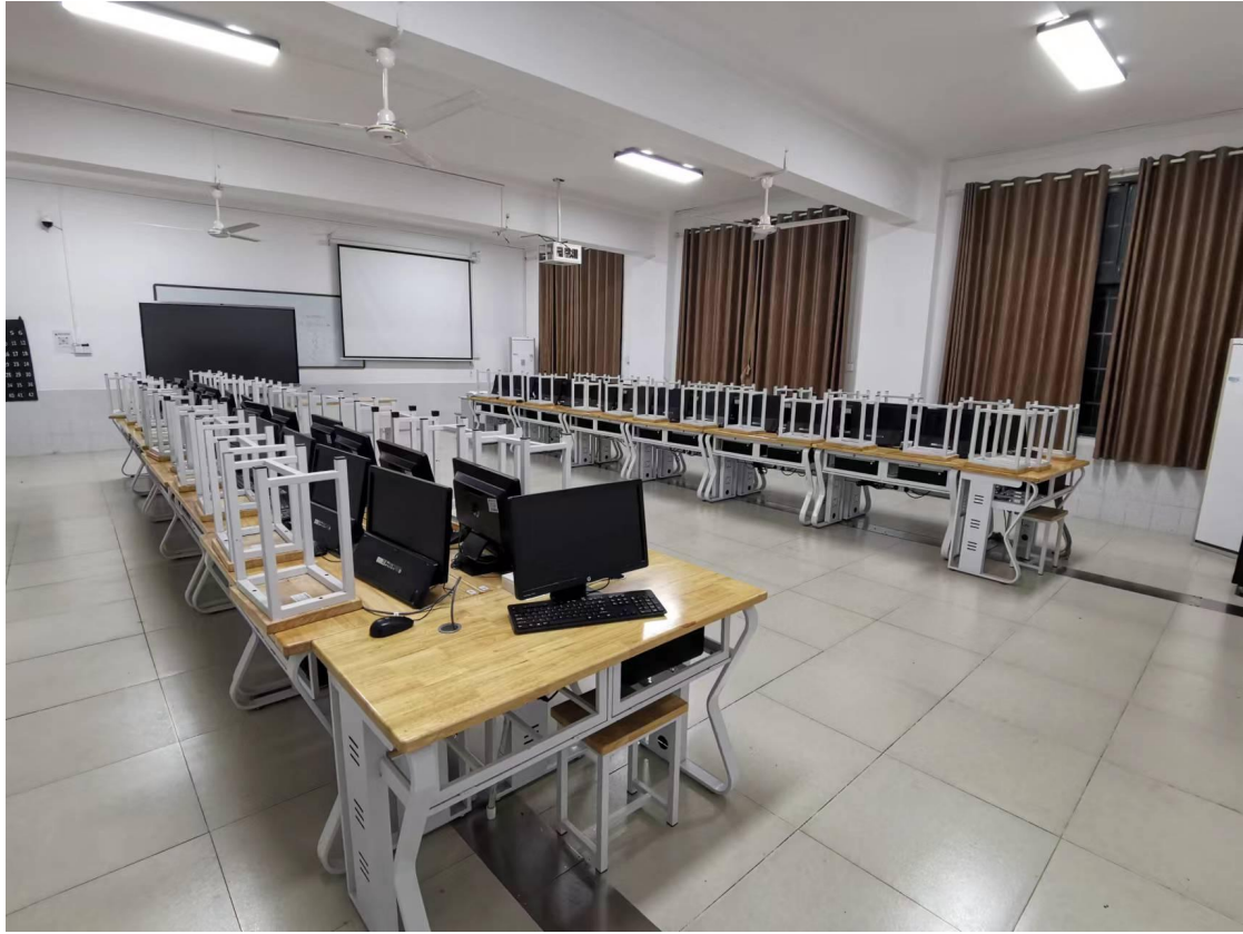
图 8 产品数字化设计与制造实训室