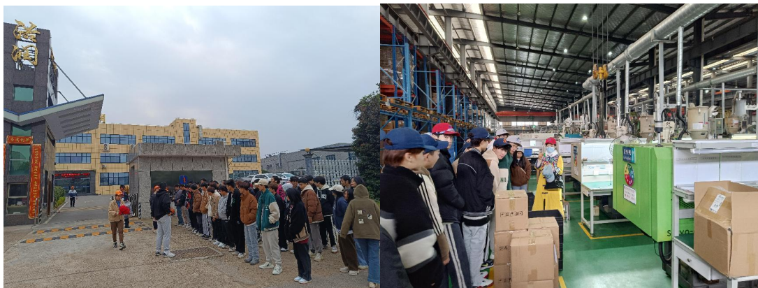
图 9 合作企业校外见习

近年来，教学团队参与省级以上项目建设 25 项；主持精品课程 8 门；主编教材 5 本；师生获得省级以上各类奖项 21 项。教学团队积极与长株潭区域内的湖南晓光汽车模具有限公司、湖南中天云航科技有限公司、磐吉奥科技股份有限公司、长沙贝斯特热流道科技有限公司、湖南浩润汽车零部件有限公司等 12 家企业发展校企合作，探索产教融合新模式，共育智能制造技能人才。先后培养 4000 多名毕业生，毕业学生遍及珠三角、长三角及长株潭地区。